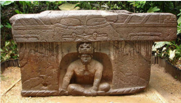
Altar Olmeca de sacrificios

LA ENERGÍA: Refiere a la idea de una fuerza central que regula el ritmo del cosmos. Existe una idea de mantener la armonía entre el humano, la naturaleza y el cosmos. De aquí podemos entender por qué estas culturas realizan ofrendas de todo tipo, hasta los sacrificios humanos, cabe aclarar que es un honor morir por un dios.